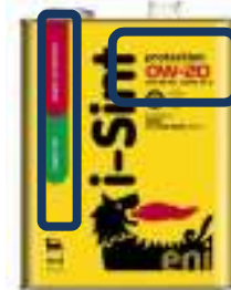
商品の主な特徴説明

新車のトレンドは、エコブームにより、超省燃費車種が主流ですが、アフターマーケットにおいては、スポーツ走行を楽しむコアなユーザー、車種や乗り方によって粘度を選ばれるユーザーもおり、幅広く選んで頂けるように2つの商品特徴、4種のおすすめ車種・乗り方に分けた商品構成としました。又、分かり易く商品の主な特徴、詳細説明をアイコンにて説明しております。(パッケージの2箇所に表示しております。)