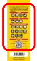
商品特徴の詳細説明